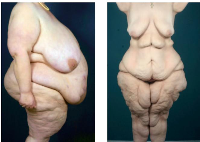
Abb. 4 Links Adipositas, rechts adipöse Patientin mit Lipödem

Die Liposuktion hat zum Ziel, das pathologisch vermehrte Fettgewebe zu entfernen und somit wieder ein Gleichgewicht zwischen Lymphproduktion und -abtransport herzustellen. Daraus resultiert eine Reduzierung