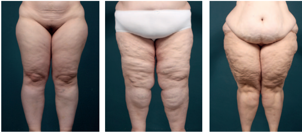
Abb. 2 Die Stadien I–III der Erkrankung.

zienz. Die Lymphflüssigkeit staut sich in das Gewebe zurück und bedingt den Gewebedruck, aus dem die starken Schmerzen resultieren.