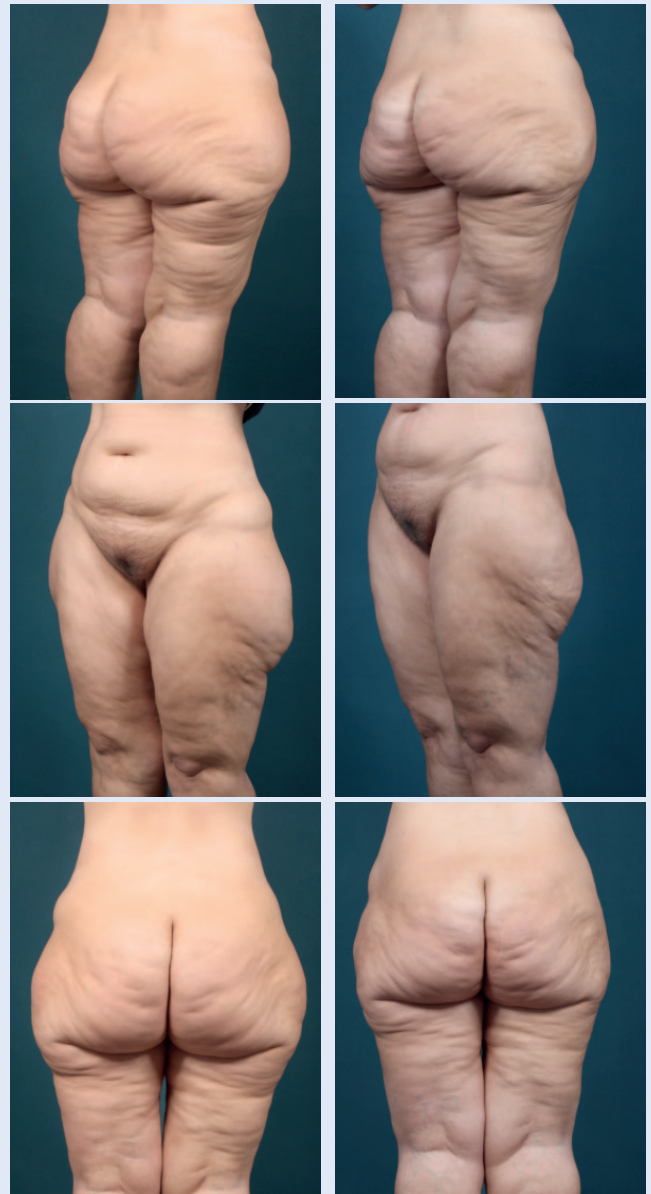
Abb. 5 Links präoperativ, rechts postoperativ.

Die 41-jährige Patientin litt unter einem Lipödem Grad II bei einem BMI von 30. Die Erkrankung lag bereits seit dem 17. Lebensjahr vor. Trotz einer Gewichtsreduktion von 32 Kilo hatte sich außer einer Abnahme am Rumpf am Gesäß und an den Oberschenkeln nichts geändert. Die Schmerzen hatten in ihrer Intensität nicht abgenommen. Wir haben in einer Sitzung am Gesäß und an den Oberschenkelaußenseiten zirka 6000 Milliliter Fettgewebe aspiriert. Nach nur einer Sitzung war die Patientin beschwerdefrei und bedurfte keines weiteren Eingriffes.